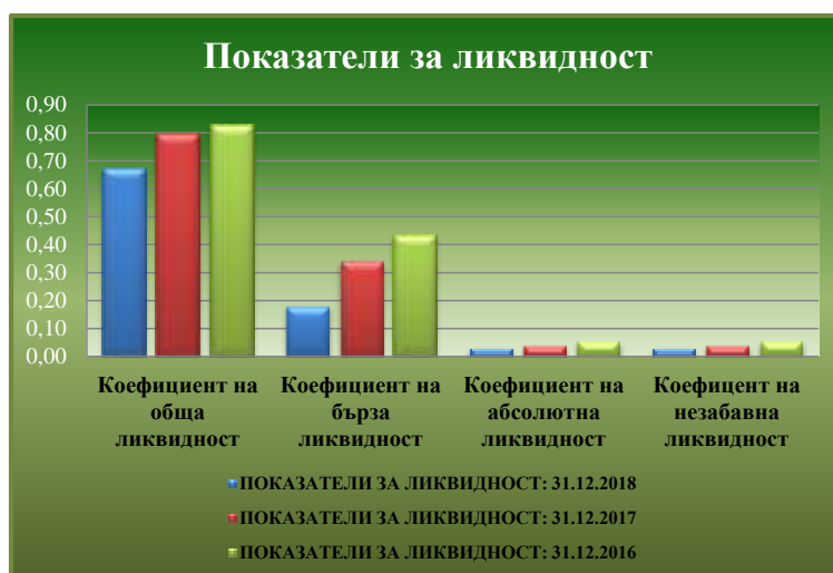
Таблица № 8